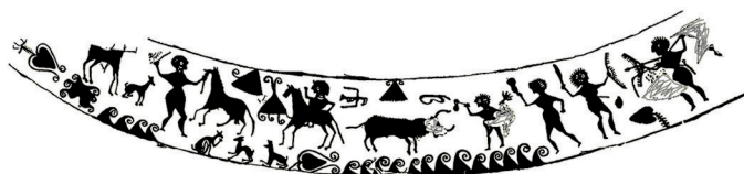
Decoració del Got de Llíria, s. III aC

En el Museu de Prehistòria de València es conserva l'anomenat «Got de Llíria», datat en el segle III aC. El seu fris mostra el que, amb tota seguretat, és el document gràfic més antic de tots els que hi ha relatiu a un joc amb bous.